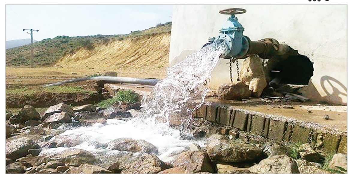
عملیات آبرسانی به لیردف جاسک