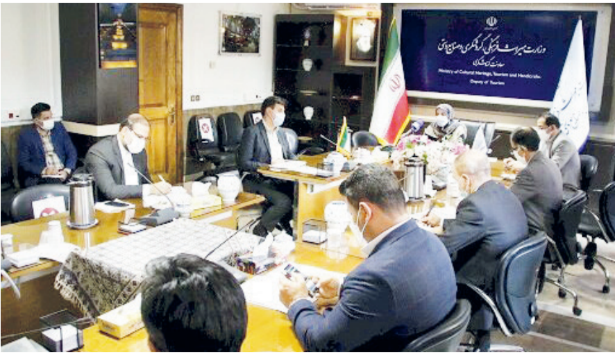
جذب تماشاگر و معرفی ایران، دو استراتژی مهم؛