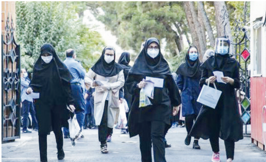
گروه علمی و آموزشی - نامه وزارت علوم به دانشگاه‌ها در خصوص ورود به دوره کارشناسی ارشد به تصمیم گیری نهایی در این باره شد. گروه علمی و آموزشی یکی از مصوبات شورای سنجش و آشناسره به مصوبه شورای پذیرش اداره کل برنامه ریزی آموزش عالی

واکنش‌های انتقادی به یک نامه داخلی وزارت علوم و تصمیم گیری درباره ممنوعیت تغییر رشته در کنکور ارشد، منجر به عقب‌نشینی این وزارتخانه از تصمیم گیری نهایی در این باره شد.