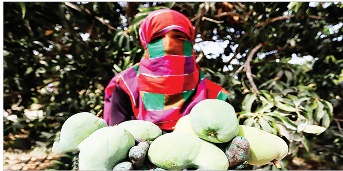
برداشت انبه رسیده از باغ‌های استان هرمزگان