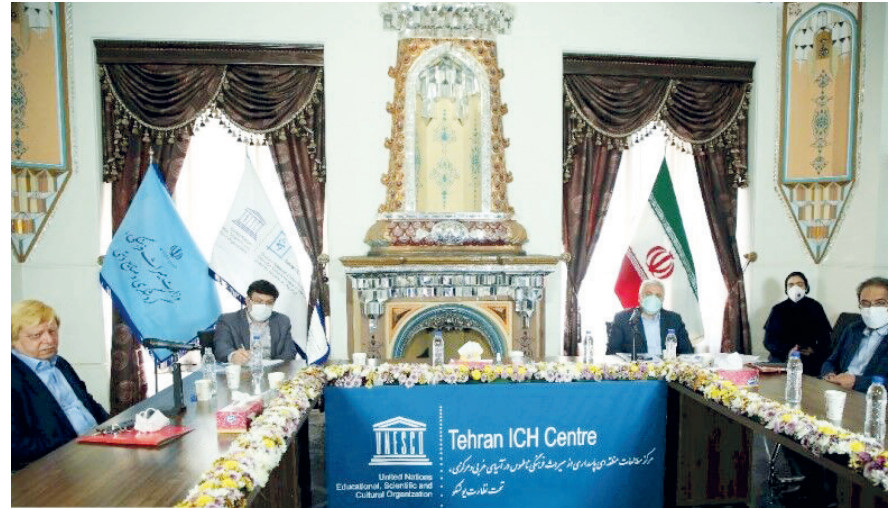
معاون میراث فرهنگی: