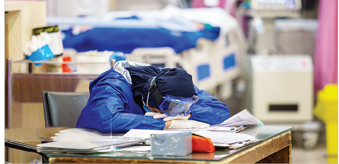
خستگی مدافعان سلامت