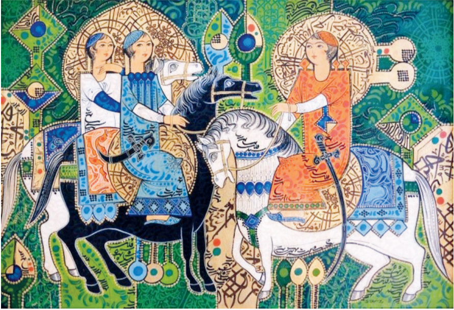
بدون عنوان این هنرمند از مجموعه سوارهای اوست و در دهه ۸۰ شمسی اجرا شده است. این نقاشی سه سوار را به تصویر می کشد و یک موفق و فنی‌آورد مدرن است. این تابلو اثر زیبا و فوق العاده‌ای از یک مجموعه دار

■ پر تقاضاترین تابلوی حراج آنلاین ساتییز در روزهای عرضه آنلاین آثار، تابلویی بدون عنوان از زنده یاد صادق تبریزی بود که ۱۸ بار بید خورد و نهایتاً به مبلغ ۱۷۶۴۰ پوند (۲۴ هزار دلار) فروخته شد.