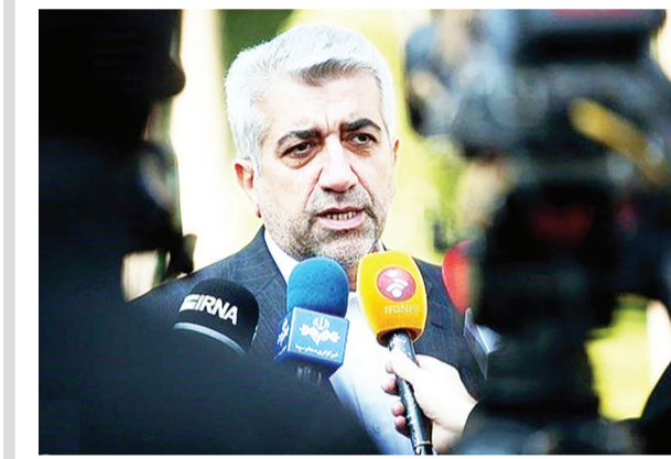
مجاوات و یک نیروگاه باز یافت تلفات حرارتی ۲ نیروگاه توربین انبساطی به ظرفیت ۱۹۲ مگاوات است. معاون وزیر نیرو و با اشاره به آمار نیروگاه‌های قابل افتتاح تا قبل از پایان دولت دوازدهم افزود: پیش‌بینی می‌شود در ماه‌های ابتدایی سال ۱۴۰۰ مجموعاً ۱۰ نیروگاه خورشیدی با مجموع ظرفیت ۷۷۳ مگاوات و ۲ نیروگاه بسادی به ظرفیت ۵۰ مگاواتی به بهره‌برداری برسد که مجموع سرمایه‌گذاری نیروگاه‌های خورشیدی ۲۶۷ میلیارد تومان و نیروگاه‌های بادی ۵۱۰ میلیارد تومان خواهد بود. رئیس سازمان ساتبا از برنامه‌های این سازمان در راستای توسعه سریع نیروگاه‌های تجدیدپذیر در سال ۱۴۰۰ خبر داد و عنوان کرد: این توسعه با دو

از ۱۱ درصد بیشتر از سال قبل انرژی تحویل دادیم، اظهار داشت: پس این یک‌سایبی با مدیریت بار در اوج تابستان به معنای کاهش انرژی نبود. دو سال متوالی ۹۸ و ۹۹ موفق شدیم برنامه‌های تابستان بدون خاموشی را با عرضه انرژی مورد نیاز و انجام کامل تعهدات صادراتی اجرا کنیم. وی با بیان اینکه هدف از اجرای برنامه‌های پیک بار تابستان ۱۴۰۰، اخلاق خوب مدیریتی مصرف است، افزود: از دهه‌ها سال قبل اوج بار ماهر سال نسبت به سال قبل ۵۲ درصد افزایش پیدایم کرد. اردکانیان مصوبات مجلس شورای اسلامی را برای صنعت آب و برق مثبت دانست و یادآور شد: یکی از مکناتیم‌های خوبی که مجلس شورای