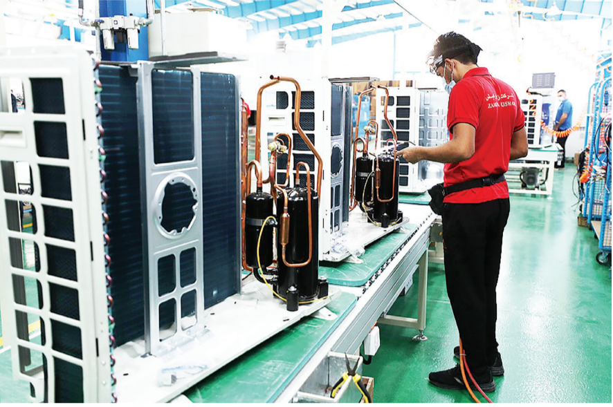
اراس، انزلی، اروند، ماکو و شهر فرودگاهی امام خمینی (ره)، در حال حاضر هشت منطقه آزاد تجاری-صنعتی ایران را تشکیل می‌دهند.

تخصیص دست کم ۵۰ درصد سپرده‌های هر یک از بانک‌های مستقر در مناطق آزاد به تأمین مالی واحدهای تولیدی و فعالان اقتصادی همان منطقه، از مهمترین توافقاتی انجام شده در نشست دبیر شورایی مناطق آزاد تجاری-صنعتی و ویژه اقتصادی و رئیس کل بانک مرکزی بود.