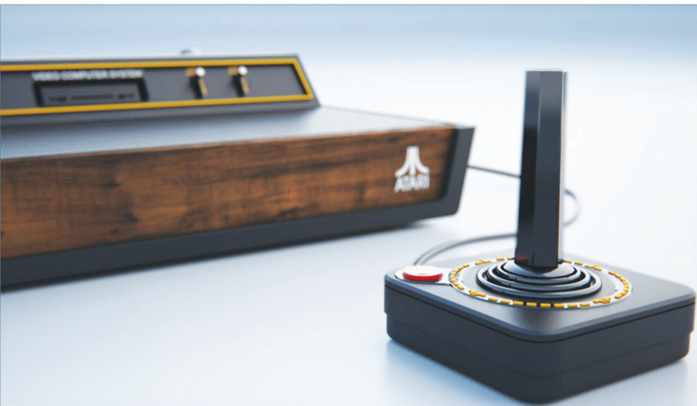
۲۶۰۰ میلیون دلار آتاری به بازارهای جهانی رسید و به سرعت محبوب شد. نام اصلی این کنسول بازی در حقیقت آتاری ۲۶۰۰ نامی بود که معادل فارسی آن به معنای «سامانه پردازش ویدیویی» است. براساس آمارهای رسمی، آتاری ۲۶۰۰ با فروش بیش از ۳۰ میلیون نسخه به دست آمد.

اگرچه آتاری ۲۶۰۰ از نظر زمانی تقریباً هیچ ارتباطی با متولدین دهه شصت ندارد اما همه آن‌ها با بازی‌های محبوب و بیش از حد ساده این کنسول بازی خاطرات تلخ و شیرین بسیاری دارند.