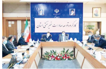
گروه اقتصادی - رئیس سازمان ملی استاندارد گفت: هرمزگان به عنوان دروازه اصلی صادرات و واردات نیازمند توجه ویژه است.