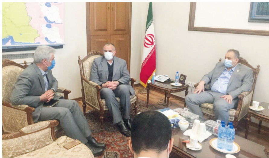
معاون دیپلماسی وزارت امور خارجه: