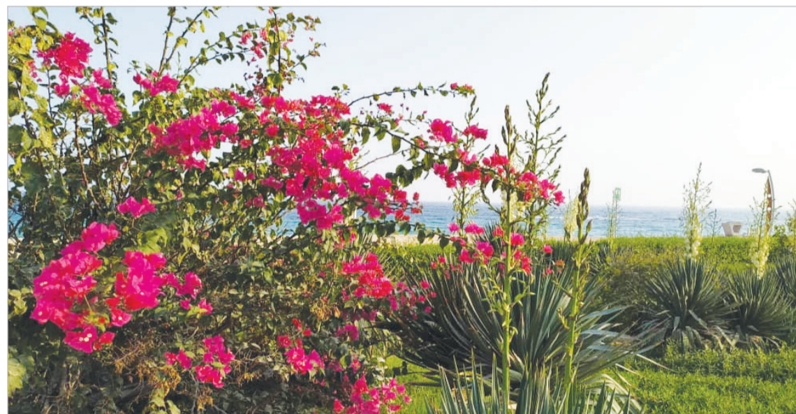
پارک سیمرغ کیش