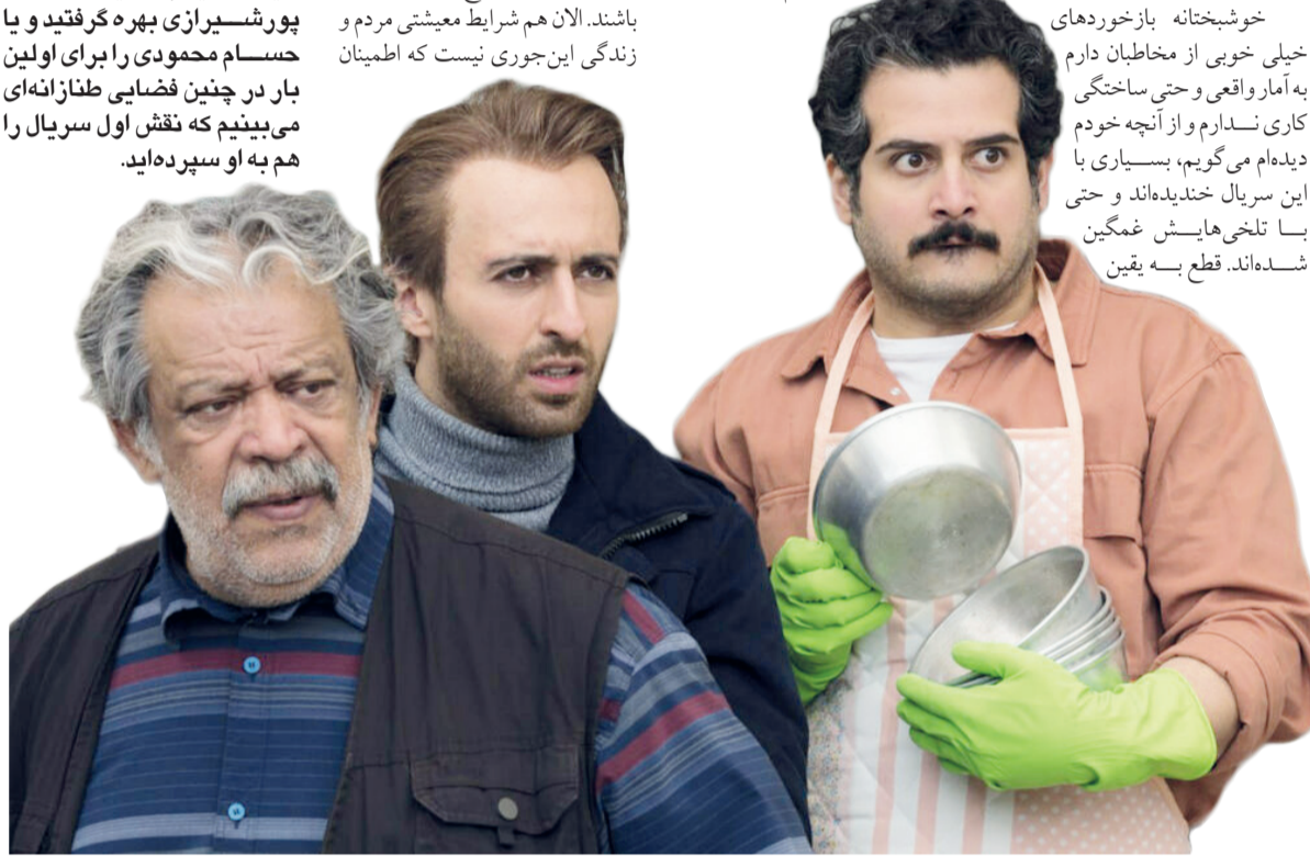
برخی از بازیگران اصلی سریال «باخانمان»

ما نباید کاری خود را سر چیزی بگذاریم و احتمال دارد ما کم کاری کرده باشیم مایک نکته را هم نباید فراموش کرد اگر قرار است کسی را بخندانیم موقعیتی که خوشبختانه بازخوردهای خیلی خوبی از مخاطبان دارم به آمار واقعی و حتی ساختگی کاری ندارم و از آنچه خودم دیده‌ام می‌گویم، بسیاری با این سریال خندیده‌اند و حتی با تلخی‌هایش غمگین شده‌اند. قطع به یقین