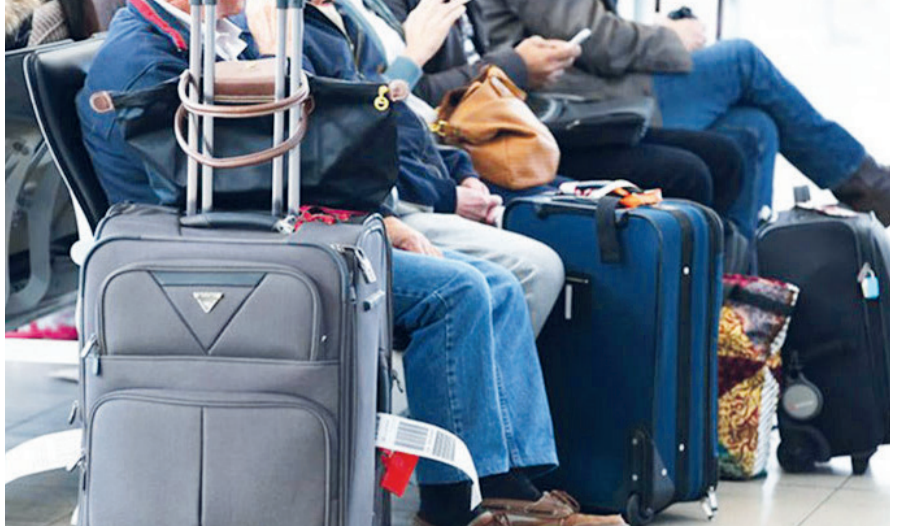
کارشناسان چه می‌گویند؟

فرهنگی، گردشگری و صنایع دستی، صنعت گردشگری از ویروس کرونا تا پایان شهریورماه متحمل بیش از ۳۰ هزار میلیارد تومان زیان مالی شده است. تعداد شاغلان بیکار شده در این بخش نیز ۸۸ هزار و ۵۰۰ نفر اعلام شده است. این در حالی است که اغلب تصمیمات گردشگری در ایران در سکوت فعالان و صاحبان گردشگری ایران گرفته می‌شود. براساس داده‌های سازمان جهانی گردشگری پیرامون افق گردشگری در سال‌های آینده، گردشگری بین‌المللی با کاهش ۹۰۰ میلیون ورودی گردشگر بین‌المللی مواجه شده است که ۷۲ درصد نسبت به مدت مشابه سال ۲۰۱۹ کاهش داشته و باعث از دست دادن ۹۳۵ میلیارد دلار درآمدهای صادراتی