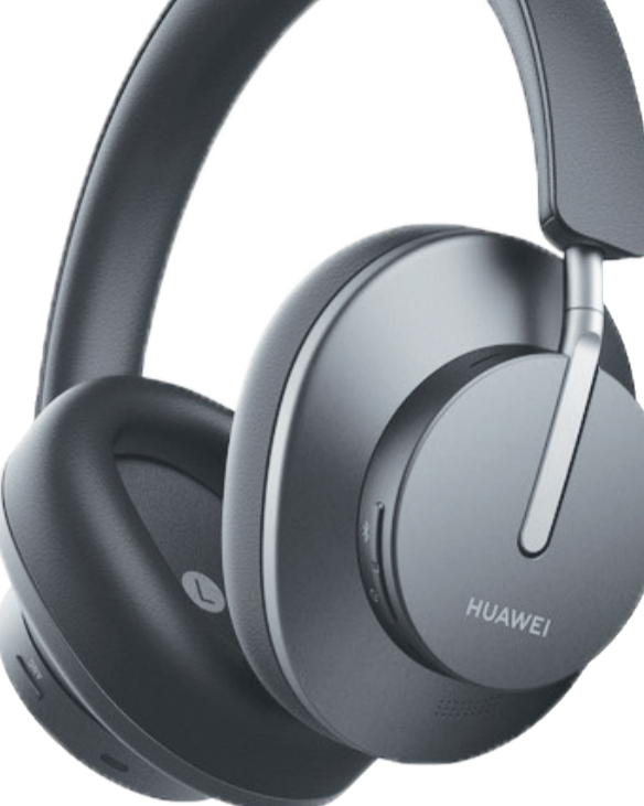
هدفون HUAWEI FreeBuds Studio

مختلف برای ANC است که با فشردن دکمه تعبیه شده بر روی گوشی چپ هدفون، می‌توان میان آنها سوئیچ کرد. برای نمونه هنگامی که در حال پیاده روی در خیابان هستید، می‌توانید به حالت Awareness Mode