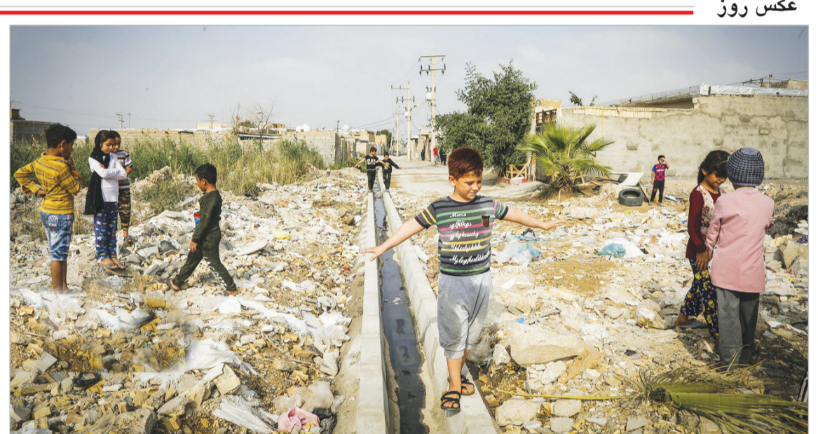
محله «کاریابی» بندر ماهشهر