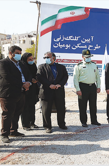
رئیس اداره محیط زیست منطقه آزاد کیش اعلام کرد:

به گزارش اقتصاد کیش، غلامحسین مظفری رئیس هیئت مدیره و مدیر عامل سازمان منطقه آزاد کیش روز گذشته در آیین عملیات اجرایی طرح مسکن بومیان کیش این طرح را یکی از مطالبات به حق بومیان این منطقه برای برخورداری از مسکن ارزان قیمت عنوان کرد و گفت: پس از سپری شدن یک فرایند طولانی، بر اساس رویکرد مسئولیت اجتماعی