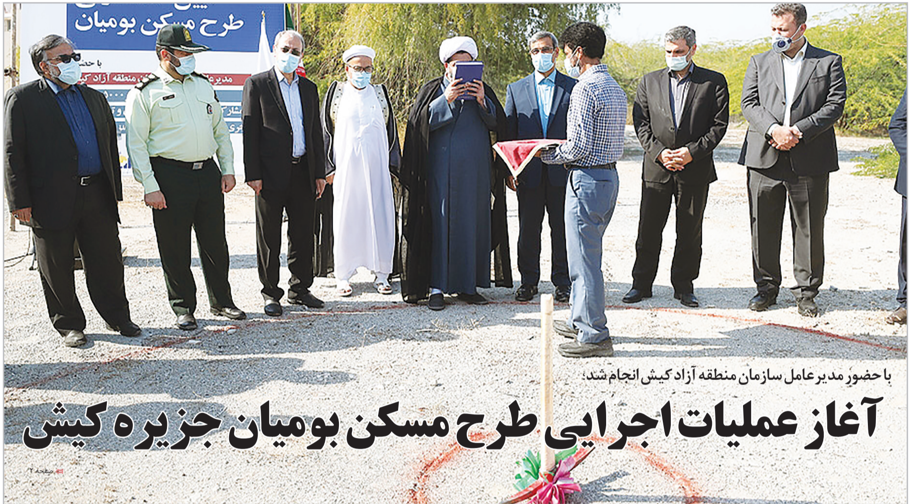
با حضور مدیر عامل سازمان منطقه آزاد کیش انجام شد: