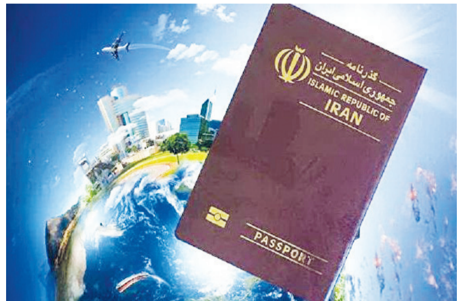
گروه گردشگری - ماجرای الزام همراه داشتن «گذرنامه مصونیت کووید» در سفرهای بین‌المللی، از یک شرکت هواپیمایی استرالیایی، اعلام برنامه زمان‌بندی تزریق واکسن کووید-۱۹ در این کشور. مدیرعامل بودن مسافران تعیین کرده است.

آغاز برنامه تزریق واکسن کرونا در برخی کشورها و بازگشایی بیشتر مرزها، گمانه‌زنی‌ها را برای تغییر «گذرنامه سفر» جدی تر کرده؛ اکنون این پرسش مطرح است که آیا «گذرنامه کووید» یا همان «پاسپورت واکسن»، قرار است شرط الزامی در سفرهای بین‌المللی شود؟