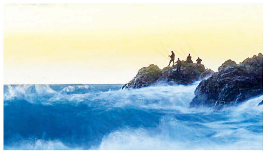
گروه گردشگری - ماجرای الزام همراه داشتن «گذرنامه مصونیت کووید» در سفرهای بین‌المللی، از یک شرکت هواپیمایی استرالیایی، اعلام برنامه زمان‌بندی تزریق واکسن کووید-۱۹ در این کشور. مدیرعامل بودن مسافران تعیین کرده است.

با توجه به شیوع بیماری کرونا و توصیه ستاد ملی مقابله به کرونا به در خانه ماندن و تأکید بر تعویق سفر به دوران پس از مهار بیماری کووید-۱۹، اکنون بهترین فرصت برای مطالعه و شناخت بیشتر جاذبه‌های فرهنگی، گردشگری و طبیعی ایران ایجاد شده است. می‌توان با بررسی دقیق، مقصدهای جذاب و جدید گردشگری را برای مسافرت‌های فردی و گروهی در دوران پسا کرونا برنامه‌ریزی کرد.