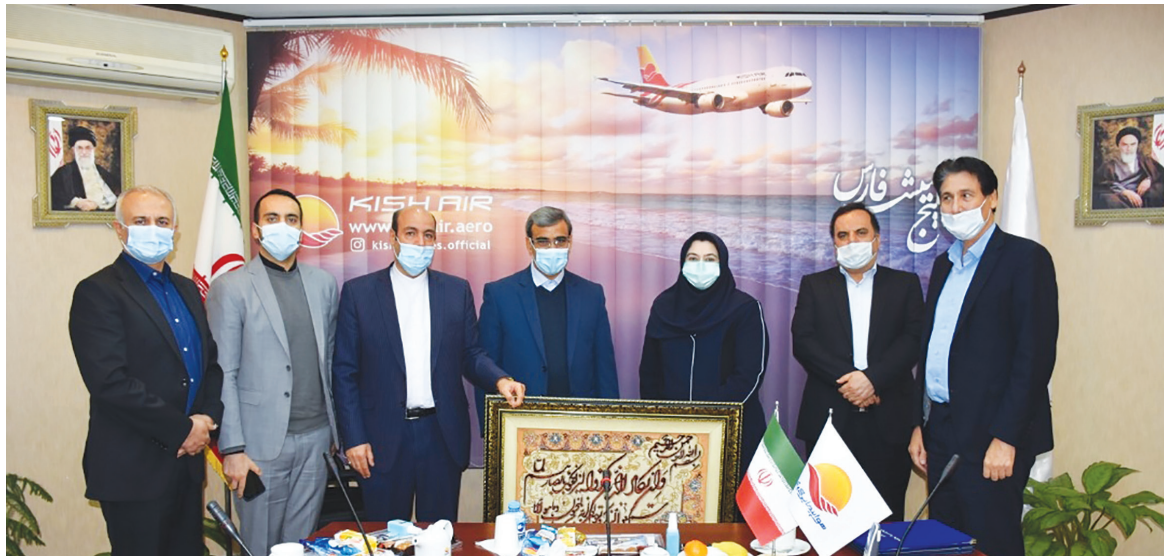
مدیر عامل سازمان منطقه آزاد کیش در مراسم معارفه مدیر عامل جدید کیش ایر

ایر از شرایط سخت کنونی به سلامت و موفقیت گذر کند و خوشنامی این شرکت به عنوان یک شرکت هوایی با شفافیت و سلامت کاری حاصل همدلی و تلاش مدیران و کارکنان مجموعه است. وی افزود: با توجه به ضرورت خصوصی سازی کیش ایر، مسئولیت این شرکت از سازمان منطقه آزاد کیش