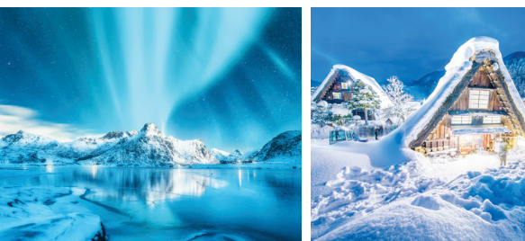
مجمع الجزایر لوفوتن در نروژ نیز

اگر به دنبال یک پادشاهی یخی در زندگی واقعی هستید، این شهر ساحلی در غرب گرینلند می‌تواند نقطه مورد نظر شما باشد چرا که توسط کوه‌های یخی احاطه شده است. کیک، کانادا اگر مناطق شهری را به جای گشت و گذار در حومه شهر یا مناظر دور افتاده