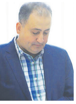
رییس‌اتاق بازرگانی بندرعباس:

پیگیری قرار داد و خواستار تامین مواد اولیه کارخانجات صنعتی و مواد غذایی در این استان شد. وی افزود: پیشنهادات و پیگیری‌ها مورد استقبال وزیر صمت قرار گرفت و با اعلام آمادگی جهت رفع موانع به‌روزی برای عملیاتی شدن موارد مطرح‌وجه به استاندار اول محترم رئیس جمهور، شورای عالی صنایع دریایی باید به سرعت فعال شود تا مسائل این بخش نیز به‌طور دقیق بررسی و حمایت از صنایع دریایی در اولویت باشد. استاندار هرمزگان همچنین رفع مشکلات دیگر صنایع هرمزگان را مورد