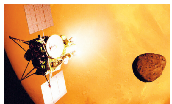
دولت ژاپن در ماه فوریه اجازه انجام ماموریت MMX را صادر کرد. هدف این ماموریت بررسی شرایط مریخ ۲۰۲۴ میلادی به فضا پرتاب شود.

گروه علمی و آموزشی - سازمان فضایی ژاپن مشغول توسعه دوربینی با وضوح AK است تا از قمرهای مریخ عکاسی کند. سازمان فضایی ژاپن با همکاری شرکت ساخت دوربین NHK) قصد دارند با استفاده از دوربین‌هایی که وضوح AK دارند از قمرهای مریخ عکاسی می‌کنند. اگر این پروژه موفقیت آمیز باشد، نخستین تصاویر از مریخ و قمرهایش با چنین وضوحی ثبت می‌شود. این ۲ سازمان برای انجام ماموریت مذکور مشغول توسعه یک دوربین با کیفیت بسیار بالا (Super Hi-Vison Camera) هستند که به فضاپیما