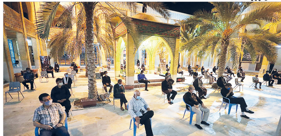
برگزاری مراسم عزاداری محرم در کیش بار عایت پرو تکل های بهداشتی