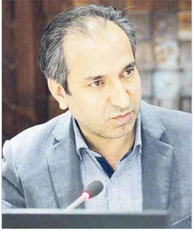
استانداردسازی هتلها و ایجاد و تعریف محور گردشگری برای شمالغرب کشور از جمله این راهکارها هستند.

رئیس جامعه هتلداران ایران گفت: میزان خسارت وارده به صنعت گردشگری کشور به دلیل شیوع کرونا هفت هزار و ۴۰۰ میلیارد تومان است اما بانکها در پرداخت تسهیلات کرونا همکاری نمی کنند.