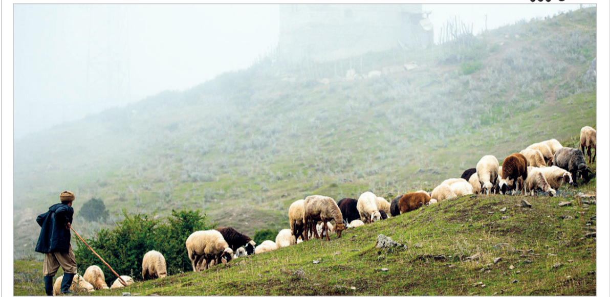
فیلبند روستایی در شهرستان بابل استان مازندران