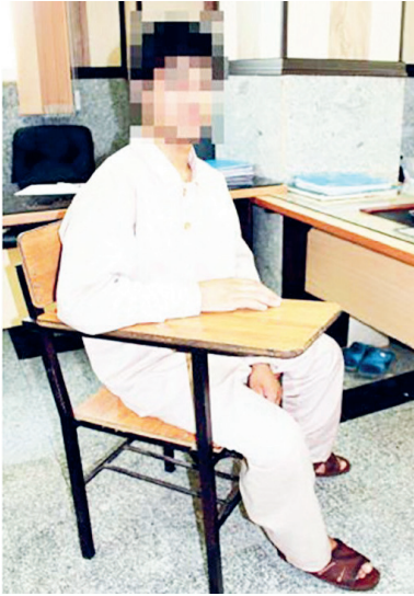
باندی تشکیل دادم و شروع کردیم.

پس رمز را اعلام نکنند تا حساب‌شان خالی نشود. اگر به سفر یا خرید می‌روید، یک کارت برای خرید اختصاص دهید و پول را براساس نیاز به آن کارت انتقال دهید. موقع خرید هم از آن استفاده کنید. بعضی کارت‌هایی که کپی می‌کردیم حکم دستبرد به کاغذ و طلا برای ما داشت.