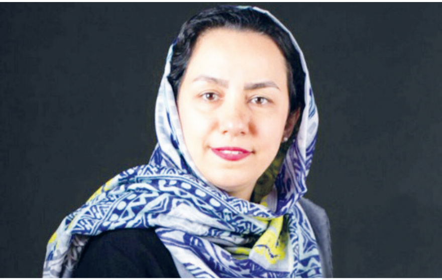
نوازنده و مدرس دانشگاه مطرح کرد: