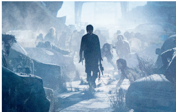
گروه سینما و تلویزیون - «شبه جزیره»، دنباله فیلم ترسناک و هیجانی «قطار بوسان» (۲۰۱۶)، با وجود ششویز کره‌نا با اقبال خوب سینماوستان در کشورهای آسیایی روبه‌رو شد.

ماجراهای شبه‌جزیره که قسمت دوم از این داستان است چهار سال پس از وقایع قسمت اول روی می‌دهد و ماجرای گروهی از افسران دریایی که مأموریت دارند به سرزمین‌های زامبی‌نوعه نبرد کنند، اما همان‌گونه که انتظار می‌رود شرایط به همین سادگی نیست و آن‌ها در حین انجام وظیفه با گروهی از بازماندگان برخورد می‌کنند. در حالی که قسمت اول فیلم بیشتر روی روابط احساسی شخصیت‌ها تکیه داشت، قسمت دوم بیشتر بر صحنه‌های اکشن تمرکز دارد. شبه‌جزیره یکی از فیلم‌های فهرست جشنواره‌ی کن امسال بود که به دلیل شیوع کرونا لغو شد.