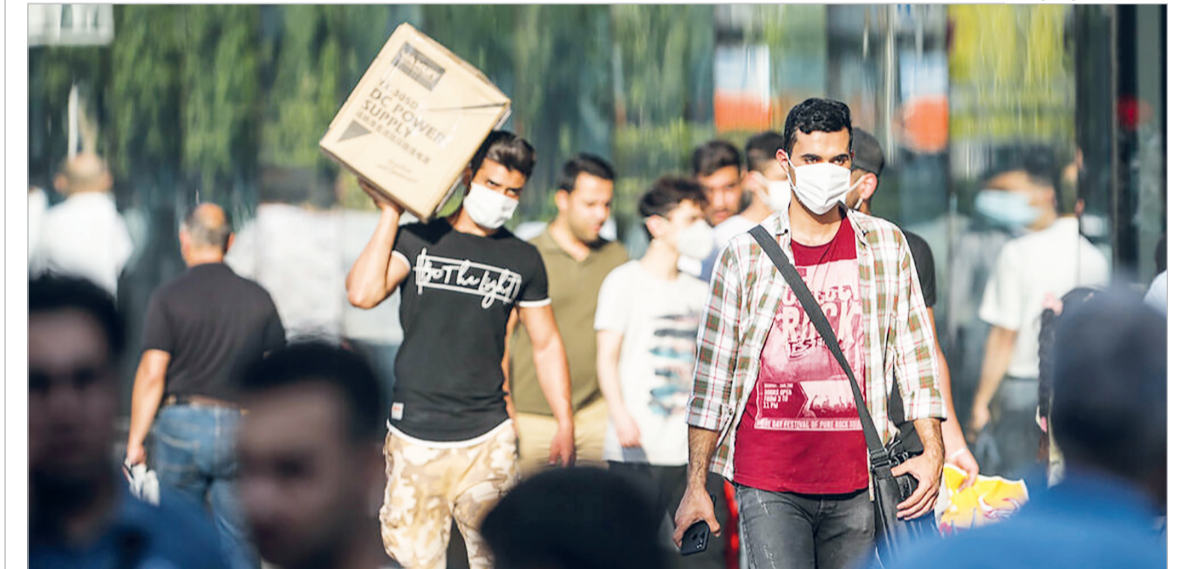
همه ماسک می زنیم