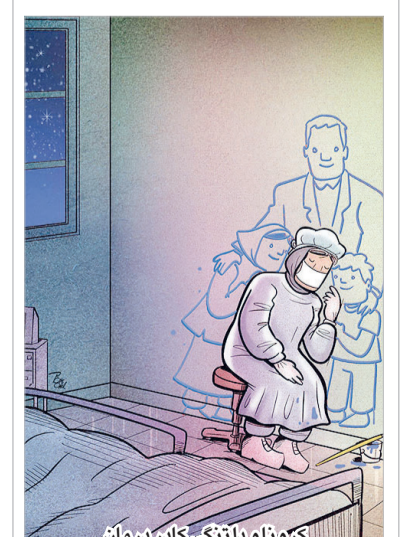
یکو و یایو دلفتنکی کیش در میان