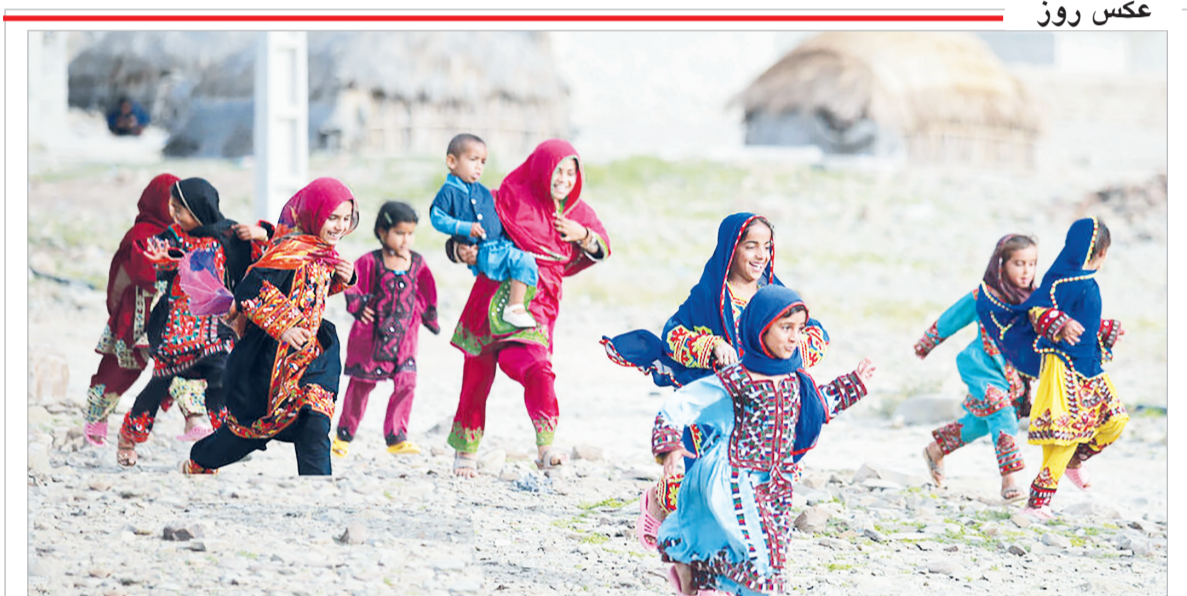
مناطق محروم سیستان و بلوچستان