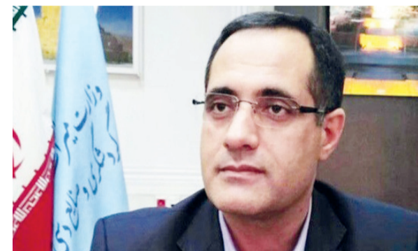
در پیشبرد روند سفرهای داخلی در فضای ویروس کرونا، مدیریت دو شرایط متفاوت در استان های کشور لحاظ شده است. نخست مدیریت توزیع سفر در استان هایی که با انباشت تقاضا و حجم بالای سفر مواجه هستند و دیگری استان هایی که به واسطه شیوع گسترده کوید ۱۹ تقاضای کمی برای سفر وجود دارد.