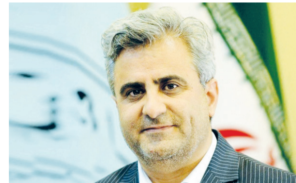
گروه گردشگری - ولی تیموری (معاون گردشگری وزارتخانه میراث فرهنگی، گردشگری و صنایع دستی) با اشاره به شرایط موجود که به واسطه شیوع ویروس کرونا در حوزه سفر و گردشگری بوجود آمده است، گفت: با پیگیری های وزارتخانه میراث و