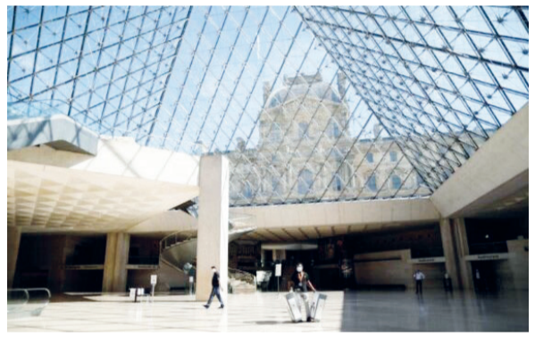
نمایش شیوع ویروس «کوید-۱۹» برای بازگشایی آماده می شود. با وجود لزوم فرانسه پس از حدود چهار ماه تعطیلی

رعایت فاصله گذاری اجتماعی و احتمال حضور نداشتن بسیاری از گردشگران خارجی در فرانسه در چند ماه پیش رو، به نظر می رسد حتی «لوور» با ظرفیتش نیز بسیار خلوت و بی سر و صداتر از حالت معمول باشد.