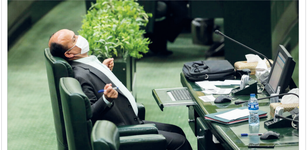
مجلس شورای اسلامی