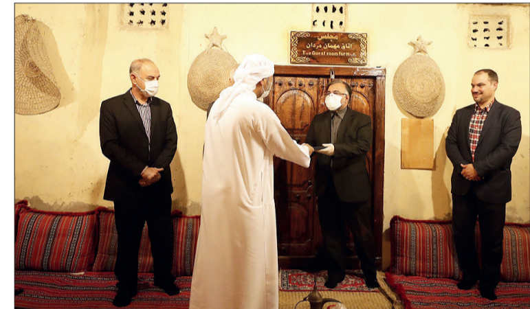
مهرپرست معاونت گردشگری سازمان منطقه آزاد کیش در جریان بازدید از موزه مردم شناسی جزیره کیش.