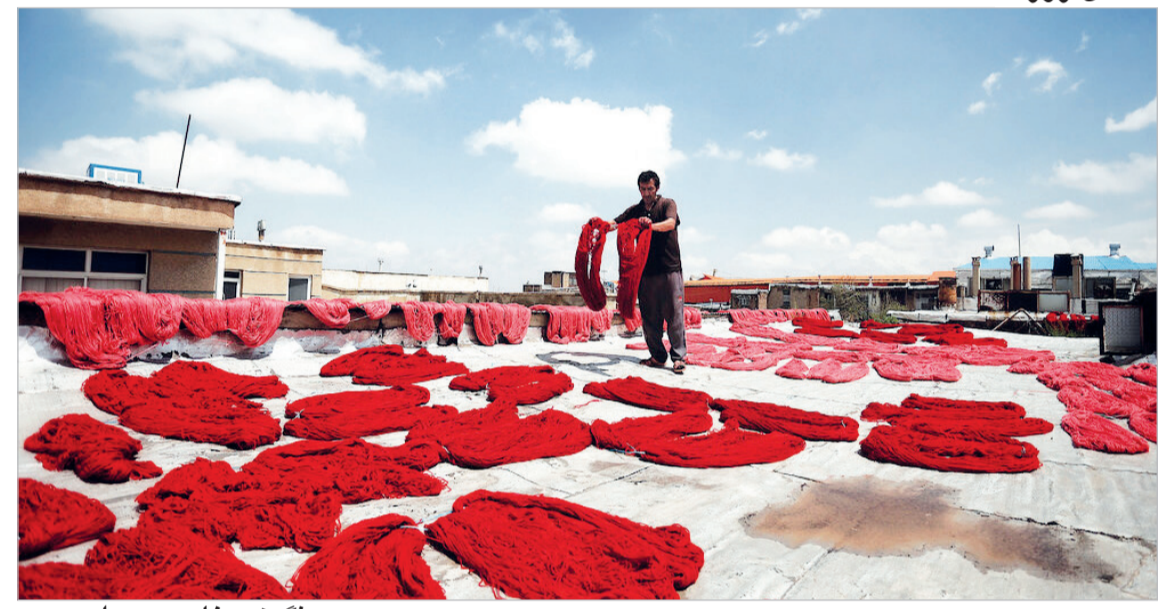
رنگرزی خامه - همدان