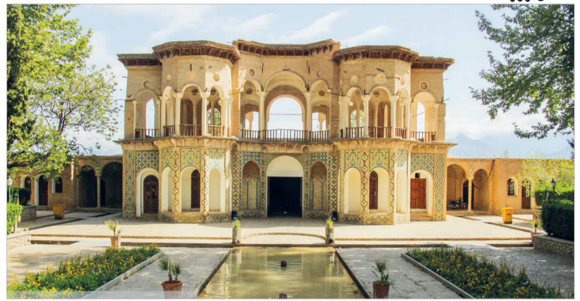
ایران زیبا - باغ شاهزاده کرمان

اوقات شرعی کیش: اذان صبح فردا: ۴:۵۵ - طلوع آفتاب: ۶:۱۶ - اذان ظهر امروز: ۱۲:۵۱ - غروب آفتاب: ۱۹:۲۵ - اذان مغرب: ۱۹:۴۲