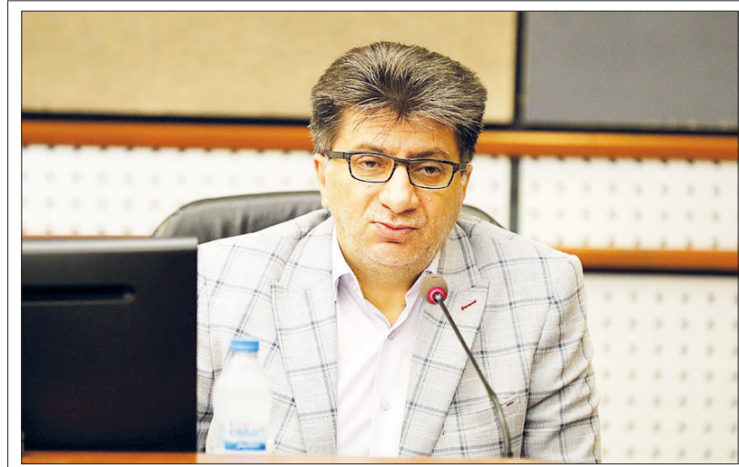
سخنگوی شورای سلامت کیش اعلام کرد:

جزیره کیش، ۲۰ روز بدون ثبت بیمار مبتلا به کرونا